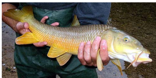
Figura 2. Detalle de la boca protráctil de un ejemplar adulto de Barbus sclateri de la cuenca del río Segura.

Su cuerpo es fusiforme, alargado y robusto, y el pedúnculo caudal es más alto que en otras especies del mismo género. La boca, relativamente pequeña, es protráctil y está situada en posición ínfera (Figura 1). Los labios son gruesos, aunque a veces el inferior se encuentra retraído, dejando ver el dentario (Gunther, 1868; Lozano Rey, 1935) (Figura 2). Presenta dientes faríngeos dispuestos en tres filas (Vélez de Medrano Sanz, 1947).