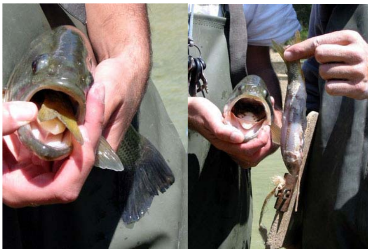
Figura 1. Detalle de la cavidad bucal de un ejemplar de Micropterus salmoides donde se puede observar la aleta caudal de un ejemplar de Barbus sclateri (foto izquierda) a punto de ser digerido (foto derecha) en la cuenca del Segura.

La introducción de especies exóticas ictiófagas, como Sander lucioperca , Micropterus salmoides (Figura 1) Esox lucius , y diversas especies de ciprínidos, entre otros, en gran parte de los ríos donde la especie está presente es una de las principales amenazas y una de las principales causas del declive de esta especie. Así, el efecto directo que las especies introducidas de carácter ictiófago presentan sobre la especie y/o especies semejantes está constatado en varios estudios (Rincón et al. , 1990; Nicola et al. , 1996). La presencia de estas especies ictiófagas altera considerablemente la dinámica de las poblaciones de B. sclateri (Bravo et al. , 2001).