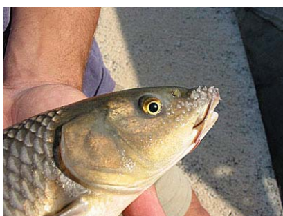
Figura 3. Detalle de los tubérculos nupciales de un macho adulto de Barbus sclateri de la cuenca del río Segura.

Presenta dos pares de barbillones largos: el primero, situado en el maxilar superior sobrepasa el borde anterior del ojo, y el segundo, en la comisura labial, sobrepasa el borde posterior del ojo. La columna vertebral consta de 43 vértebras. Las aletas presentan una base relativamente corta y la caudal está escotada, con lóbulos de perfil agudo. Las aletas pelvianas están en posición ventral. La fórmula de las aletas es: D III-IV/8; A III-IV/5; V I/8 y P16. El último radio sencillo de la aleta dorsal presenta denticulaciones de tamaño medio en casi toda su extensión, y son más pequeñas y numerosas (más de dos por mm) que en B. comizo y B. microcephalus . Presenta de 43 a 50 escamas en la línea lateral, menos que otras especies del mismo género, y de 13 a 19 branquias. La coloración general del cuerpo es críptica y en los ejemplares adultos existe un fuerte contraste entre la parte ventral clara y el dorso oscuro. Los juveniles suelen tener numerosas manchas pardas distribuidas irregularmente por el dorso, flancos y aletas dorsal y anal. En época reproductora los machos desarrollan en la cabeza tubérculos nupciales (protuberancias blanquecinas que salpican irregularmente las distintas zonas de la piel cefálica) grandes y llamativos (Figura 3) y se acentúa la diferencia de color entre el dorso y el vientre (Gunther, 1868; Lozano Rey, 1935).