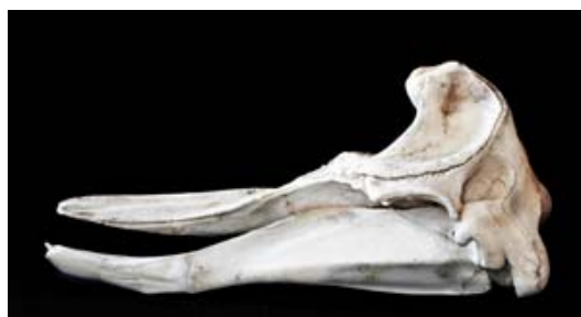
Figura 2. Vista lateral del cráneo de una hembra adulta de Z. cavirostris (SGHN MA0749). Museo da Natureza de la Sociedade Galega de Historia Natural.