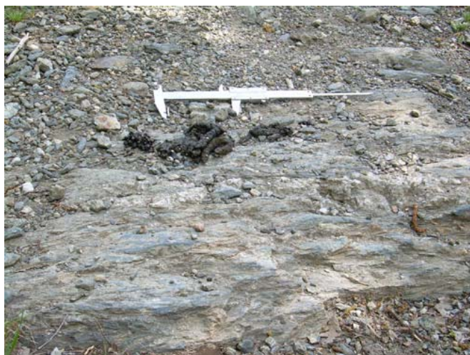
Figura 2. Excrementos de marta europea con función de marcaje, formando letrina.

La frecuencia de marcaje fecal es mayor durante julio y mayo, el periodo de celo y cría (Barja, 2005a). La marta de Menorca también deposita mayor número de excrementos durante el periodo julio-agosto (Clevenger, 1994). En Finlandia las frecuencias de defecación no varían entre los meses de octubre y marzo (Pulliainen, 1982). Varios estudios indican que el marcaje oloroso está relacionado con la reproducción e implicado en funciones básicas como la