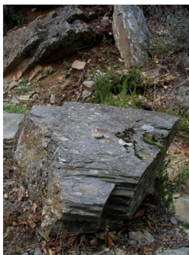
Figura 1. Excrementos de marta europea con función de marcaje, depositados sobre una piedra (sustrato llamativo y elevado).

La marta utiliza como marcas oloroso-visuales además de secreciones de las glándulas anales y ventrales, orina y heces (Pulliainen, 1982; Brinck et al., 1983; Hutchings y White, 2000; Barja, 2005a). Las heces con una función en la comunicación química son depositadas sobre sustratos llamativos y/o elevados (principalmente piedras y matas de hierba) y generalmente forman letrinas constituidas de 6 a 10 deposiciones, aumentando así la eficacia de las señales fecales (Pulliainen, 1982; Barja, 2005a). La altura media a la cual son depositadas las heces es de 5,8 cm (rango= 2,5- 9,5 cm ; n= 156) (Barja, 2005a). La especie selecciona los laterales y centro de los caminos para depositar las marcas fecales y en zonas de laderas el 64,6% de los excrementos son emplazados principalmente en la región exterior del camino, la más expuesta (Barja, 2005a). La marta deposita una alta proporción de marcas fecales cerca de los bordes territoriales y en zonas centrales de los mismos (Pulliainen, 1982).