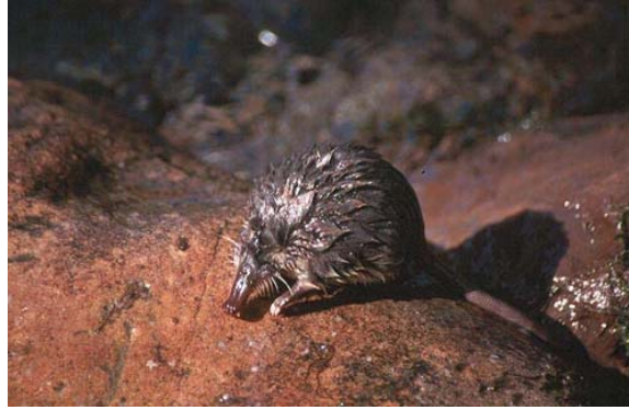
Figura 1. Desmán ibérico.