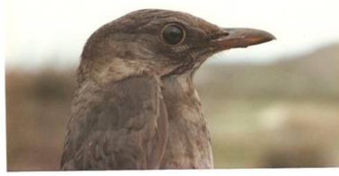
Figura 3. Hembra joven en enero, 5 EURING. Centro de España.

Plumaje juvenil: profusamente moteados, tanto por arriba como por abajo, con fondo pardo rojizo. Garganta ante, estriada de pardo. Rectrices centrales más estrechas y puntiagudas que las de los adultos. Pico y anillo ocular pardo oscuro. Sexos indiferenciables en la práctica. A partir de julio sustituyen este plumaje por el de primer invierno, pareciéndose gradualmente a los adultos. Son claramente diferenciables de los adultos en el campo.