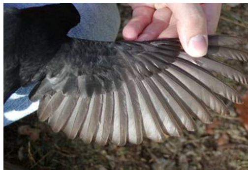
Figura 2. Ala de un macho joven en octubre, 3 EURING. Centro de España.

Macho joven: negruzco, con el pico oscuro hasta noviembre y ya amarillo desde enero. No obstante, los mirlos de Europa septentrional presentan el pico oscuro aún en primavera. Las partes inferiores presentan un moteado poco perceptible. La garganta suele ser blancuzca y estriada, como la de las hembras. El mejor criterio para diferenciarlos de los adultos es mediante el estado de muda, pues retienen las plumas de vuelo juveniles y un número variable de cobertoras mayores (figura 2. Nótese el límite de muda entre las cobertoras mayores más externas, juveniles y con las puntas parduscas, y las más internas, negruzcas y ya mudadas y, especialmente, entre las terciarias 8ª y 9ª postjuveniles y negruzcas y la 7ª retenida y pardusca, muy parecida a las rémiges secundarias sin mudar.) De cerca se aprecian sus rémiges primarias parduscas, pero en realidad es muy dificultoso diferenciar edades en el campo, a no ser que se capturen para anillamiento.