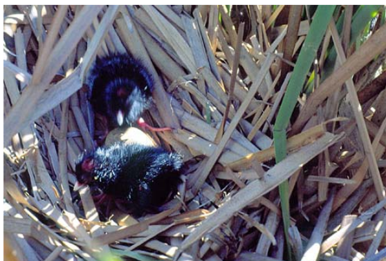
Figura 1. Nido de calamón.

Los pollos, nidífugos a las pocas horas de nacer, nacen con un plumón negro, patas de color rosado y pico blanco o azul claro, en el que, sin embargo, se comienza a apreciar el desarrollo del escudete rojo. Las patas son de color azul negruzco (Glutz von Blotzheim et al., 1973; Cramp y Simmons, 1980).