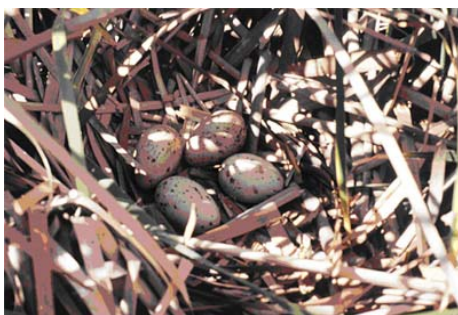
Figura 1. Puesta de Calamón.

El tamaño de puesta oscila entre 2 y 8 huevos en la mayoría de los estudios en las distintas áreas de distribución (Hidalgo, 1973; Cramp, 1980; Bauer et al., 1982; Sánchez-Lafuente, 1992; Ferrer et al. 1986), con un valor medio estimado de 4 huevos por nido (Figura 1). Las hembras suelen poner un huevo cada día, si bien en puestas de 6-7 huevos se ha observado que el último, y a veces el penúltimo, huevo se depositaba con una diferencia de hasta 48 horas (Sánchez-Lafuente, obs. Pers.).