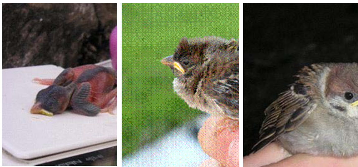
Pollo con cinco días de edad (izquierda), pollo de diez días (centro) y pollo volantón con aspecto casi de adulto (derecha).