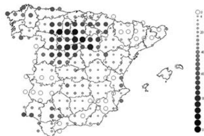
Figura 1. Los círculos representan el porcentaje de cuadrículas UTM 10x10 km ocupadas por la Lavandera Boyera en bloques UTM de 50x50 km, Sociedad Española de Ornitología .

Ocupa el 26% de las cuadrículas UTM de 10x10 km de España (Figura 1). Según datos del último atlas nacional (Martí y Del Moral 2003) el núcleo continuo de mayor extensión se constituye en la submeseta norte, seguido por el valle del Guadalquivir. También son relevantes las numerosas poblaciones costeras, distribuidas por todo el perfil peninsular, aunque con poca o nula penetración tierra adentro, salvo en los casos de Lugo, Orense y Huelva donde las poblaciones litorales se adentran difusamente siguiendo las vegas fluviales. En el resto de la Península Ibérica sólo se presenta aisladamente asociada a los parches húmedos más propicios, en general relacionados con actividades agrícolas de regadío. Es un ave rara en todos nuestros sistemas montañosos, y en extensas áreas de Extremadura, y del interior de Andalucía Oriental y Cataluña. En Baleares se la considera moderadamente abundante en Mallorca e Ibiza aunque no está ampliamente distribuida, siendo escasa en Formentera (G.O.B. 2001).