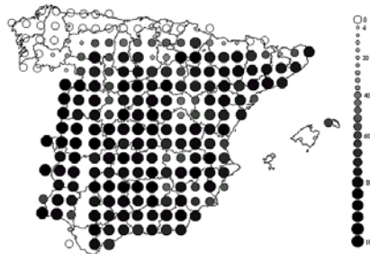
Figura 1. Los círculos representan el porcentaje de cuadrículas UTM 10x10 km ocupadas por la especie en bloques UTM de 50x50 km, Sociedad Española de Ornitología .

Distribuido por la inmensa mayoría del Centro y Sur de la península (Fig.1), sólo faltando en la mayoría del sector atlántico Ibérico y en la alta montaña pirenaica, y siendo menos frecuente en los macizos montañosos del centro y sur.