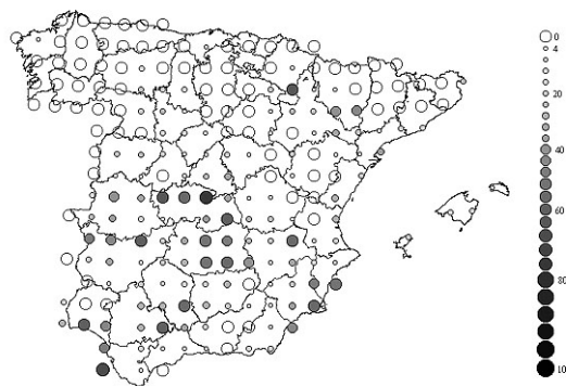
Figura 1. Los círculos representan el porcentaje de cuadrículas UTM 10x10 km ocupadas por la especie en bloques UTM de 50x50 km, Sociedad Española de Ornitología .

Especie de reparto irregular a lo largo del sector español de la Península Ibérica. La mayor frecuencia de aparición en cuadrículas UTM de 10x10 km dentro de bloques de 50x50 km se produce en algunas áreas del centro y sur de la península y en la cuenca del Ebro (Figura 1)