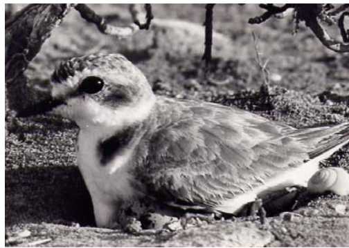
Figura 3. Macho de Chorlitejo Patinegro incubando de día. Aunque los machos tienden a incubar de noche, en algunas localidades incrementan su participación en la incubación diurna con las temperaturas ambientales.

La nidificación en sitios abiertos le supone a los adultos el tener que soportar unas temperaturas que en ocasiones pueden superar, a nivel del suelo, los 50°C. Para afrontar las elevadas temperaturas mientras incuban, los chorlitejos despliegan una serie de mecanismos, tanto fisiológicos como de conducta (Amat y Masero, 2004b). Los machos efectúan la incubación nocturna, en tanto que las hembras incuban casi exclusivamente de día (Fraga y Amat, 1996). En Fuente de Piedra la probabilidad de que el macho releve a la hembra en el nido durante las horas de más calor está directamente afectada por la temperatura máxima diaria, lo que sugiere que durante la incubación las hembras no son capaces de soportar durante largos períodos de tiempo una temperatura ambiental elevada (Amat y Masero, 2004b; Figura 3). No obstante, durante las olas de calor se produce un abandono considerable de nidos, ya que los chorlitejos son incapaces de hacer frente a unas temperaturas muy altas (Amat y Masero, 2004b). La propensión a abandonar los nidos, sin embargo, está relacionada con la distancia a la zona inundada más próxima; probablemente el disponer de agua cerca permite a los chorlitejos bañarse ("belly-soaking"), con lo que regularían más fácilmente su temperatura corporal y eso le permitiría una atención más prolongada de los nidos (Amat y Masero, 2004b). Este comportamiento sirve tanto para la termorregulación del adulto como para el enfriamiento de la puesta (Amat y Masero, 2007). 2