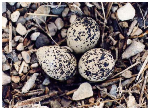
Figura 1. Puesta de Chorlitejo Patinegro.

Los huevos son de color pardo pálido o pardo-grisáceo claro, con manchas o listas negras, generalmente concentradas en el extremo más ancho (Figura 1).