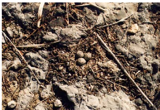
Figura 2. Nido de Chorlito de Patinegro.

Algunos nidos son reutilizados en una misma temporada (Lorenzo, 1993; Amat et al. , 1999a). Concretamente, en Fuente de Piedra hasta un 6 % de los nidos es reutilizado dentro de la misma temporada de cría. La frecuencia de reutilización es mayor en sitios donde el sustrato es duro (Amat et al. , 1999a). En esa localidad la mayor parte de los nidos (70%) está en lugares con poca o ninguna cobertura. Al nidificar en sitios con poca cobertura, los adultos detectan con más facilidad la aproximación de predadores que cuando incuban en sitios con cobertura. De hecho, los adultos son predados con más frecuencia en los nidos cubiertos que en los expuestos (Amat y Masero, 2004b). Sin embargo, no existen diferencias en el éxito de los nidos dependiendo de su grado de cobertura (Fraga y Amat, 1996; Figuerola y Cerdà, 1997; Amat y Masero, 2004b).