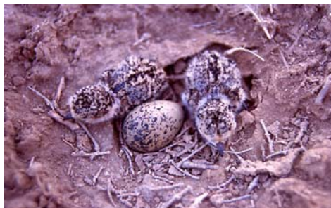
Figura 1. Pollos de Chorlito Patinegro antes de abandonar el nido tras la eclosión.

Los juveniles son similares a las hembras, pero en los bordes de las cobertoras y escapulares presentan una franja de color más pálido que el resto de la pluma. Los pollos nacen con plumón y son capaces de abandonar el nido tras la eclosión. Las partes dorsales son de color pardo-grisáceo con moteado negro, en tanto que las ventrales y la posterior del cuello son blancas (Figura 1). Empiezan a emplumar antes de la segunda semana de vida y son capaces de dar pequeños vuelos a partir de la tercera semana, aunque no desarrollan una buena capacidad de vuelo hasta los 28-30 días.