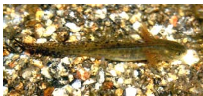
Figura 2. Larva desarrollada.