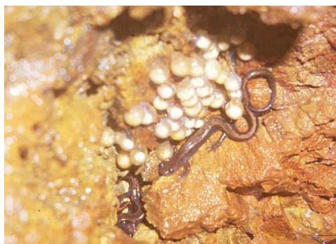
Figura 2. Adultos junto a una puesta.

Como todos los salamánderos, Chioglossa presenta fecundación interna. Durante el acoplamiento, el macho deposita una estructura gelatinosa, el espermatóforo, que la hembra posteriormente introduce en su cloaca. Esta estructura, en Chioglossa , es un cono regular de una altura de 5 mm y un diámetro basal de 2 mm. Está cubierto de una capa de esperma de menos de 1 mm en diámetro (Arnold, 1987).