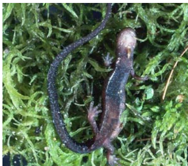
Figura 1. Vista ventral de una hembra en la que se aprecian los huevos a través de la piel.

La salamandra rabilarga es un animal esbelto y elegante, con un cuerpo muy alargado. Las extremidades anteriores y posteriores, con cuatro y cinco dedos respectivamente, son relativamente cortas. Su cola, cuando no está regenerada, es especialmente larga, alcanzando longitudes que duplican la longitud de cabeza y cuerpo, siendo relativamente más largas en animales más grandes. La cabeza es deprimida y redondeada en la parte anterior; los ojos son grandes y protuberantes, situados en posición lateral. La piel es lisa y reluciente. La longitud total puede alcanzar 156 mm en machos y 164 mm en hembras (Arntzen, 1999), mientras que la longitud modal de cabeza y cuerpo es de 43 mm en machos y 45 mm en hembras (en poblaciones portuguesas). El peso medio es de 2,0 g en animales adultos y 1,3 g en individuos subadultos (con una longitud cabeza-cuerpo de 38 mm); el peso máximo de una hembra con huevos era de 3,3 g (Arntzen 1999).