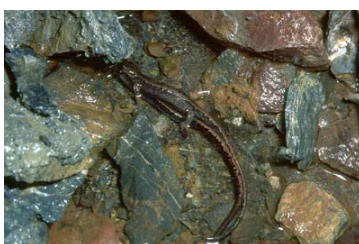
Figura 1. Apareamiento de Chioglossa lusitanica .

El acoplamiento es terrestre y fué descrito por primera vez por Thorn (1966) y más tarde en detalle por Arnold (1987). Las observaciones de otros autores (Arntzen, 1981; Vences, 1989, 1990; Gilbert y Malkmus, 1989) coinciden con esta descripción.