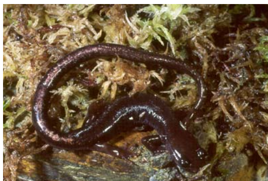
Figura 2. Ejemplar con las bandas dorsolaterales poco marcadas.

El dorso y los costados presentan una coloración de pardo oscuro a negro, el vientre es algo más claro. Dos bandas dorsolaterales de color bronceado o cobrizo se extienden por todo el cuerpo y la cola. En las partes posteriores de la cola las dos bandas se fusionan formando una sola banda dorsal. Los bordes de las bandas son muy irregulares, con ondulaciones y punteaduras. En la cabeza, y a veces también en la cola, las bandas tienden a descomponerse en numerosos puntos y manchas. (García-París, 1985; Barbadillo et al., 1999; Salvador y García-París, 2001; García-París et al., 2004).