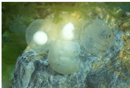
Figura 3. Vista detallada de dos embriones.

Los huevos son grandes, esféricos y carecen de pigmentación (son blancos). Su diámetro se cita como 4 mm, llegando de vez en cuando a 5-8 o incluso 11 mm (Arntzen 1999), pero estos datos son en parte dudosos siendo posible que no se refieran al huevo sino a la cápsula gelatinosa que lo cubre. Según datos recientes de D. R. Vieites (comunicación personal), el diámetro del huevo sería de 3-4 mm.