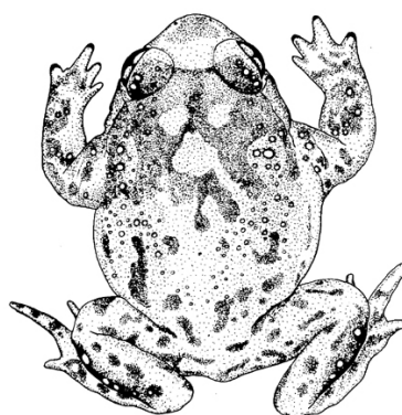
Figura 1. Aspecto dorsal de Alytes cisternasii . MNCN 20.878.

La descripción original de Boscá (1879) es generalmente válida hoy, como lo reflejan las descripciones más recientes de Crespo (1981c, 1982c), Barbadillo et al. (1999), Salvador y García París (2001) y García-París et al. (2004). Cabeza ancha y corta (como un tercio más ancha que larga en relación al cuerpo). Hocico redondeado. Ojos grandes y prominentes en disposición lateral. Pupila vertical e iris dorado vermiculado en negro sobre todo en su mitad inferior. Tímpano y pliegue gular bien visibles. Glándulas parotídeas reducidas y casi imperceptibles. Dientes vomerinos dispuestos en dos grupos de 9 a 12 dientes. Lengua circular y entera. Cuerpo corto y muy rechoncho (Figura 1). Miembros muy cortos y fuertes. Miembros anteriores robustos y muy cortos (semi envueltos en la piel del tronco) con cuatro dedos sin membrana interdigital. Con dos tubérculos metacarpianos. Miembros inferiores cortos, con un tubérculo metatarsiano cónico-truncado hacia delante, y con dedos sin tubérculos subarticulares y con membrana interdigital muy reducida. Piel de aspecto general laxo, de textura lisa y fina sobre la cara y porción superior de los dedos en las cuatro extremidades. En el dorso y ventralmente la piel es ligeramente granulada, faltando los folículos sobre la cara interna de los brazos y piernas y la externa de los muslos, y la parte inferior de la zona ventral del abdomen (aquí la piel es lisa y casi transparente).